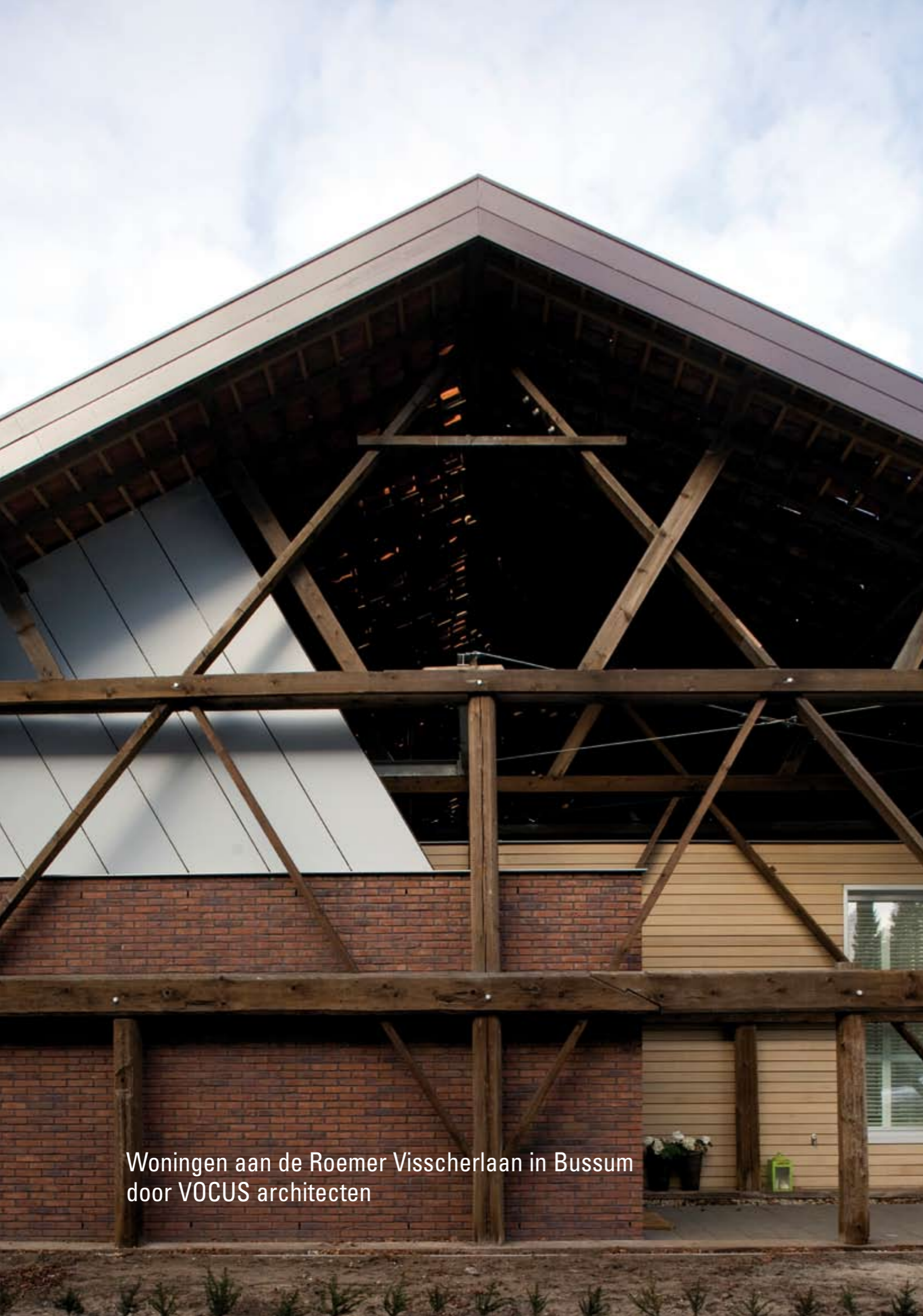
Woningen aan de Roemer Visscherlaan in Bussum door VOCUS architecten