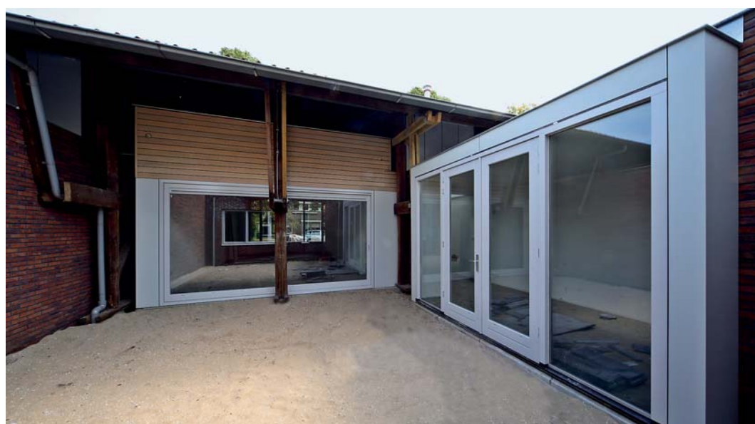
Achter de loods zetten de woningen zich voort met een patio met gang erlangs, en een achterhuis van twee etages.