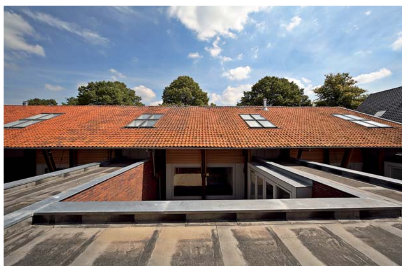
Uitzicht vanuit de slaapkamer.