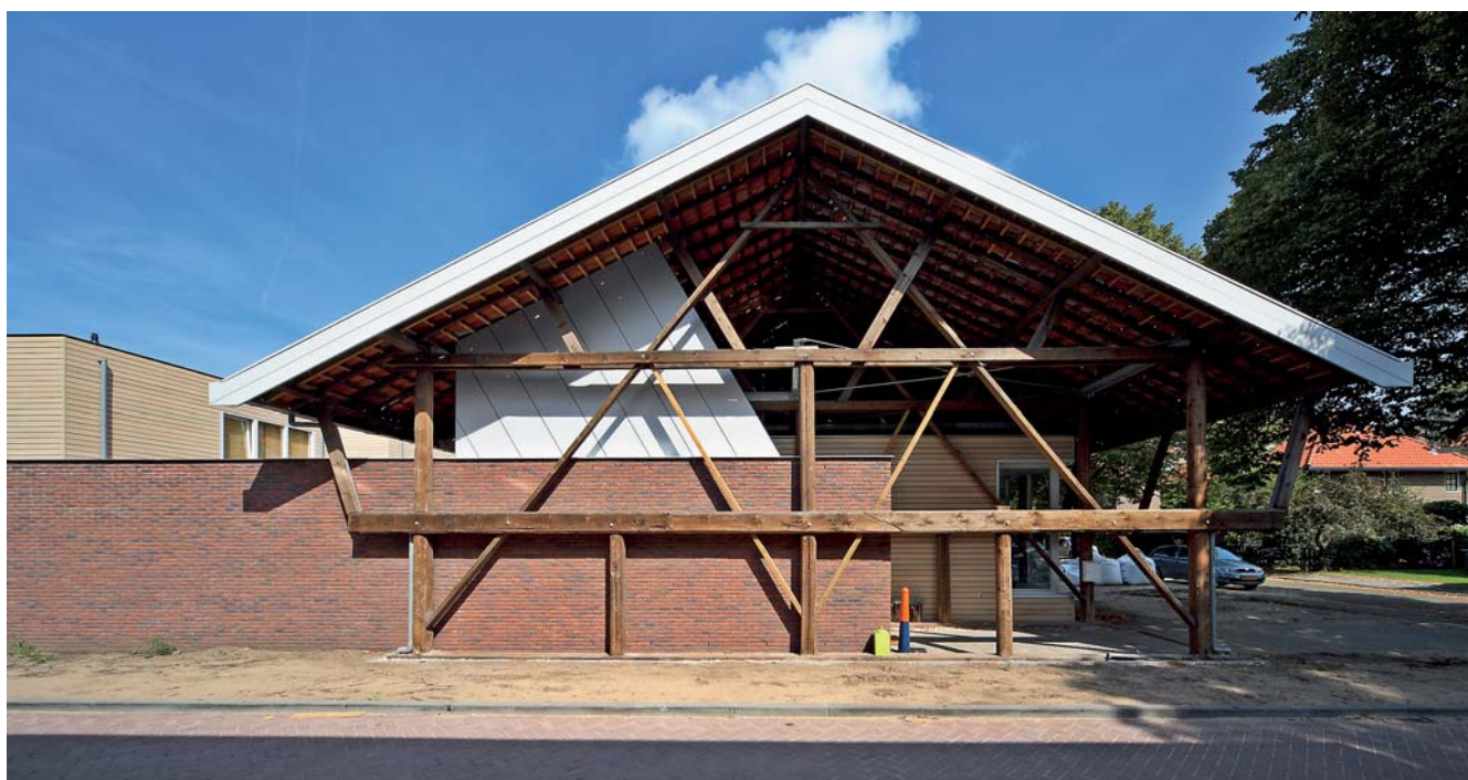
De hal ontvangt zijn licht dankzij een scheve lichtschacht parallel met de schuine schoren.